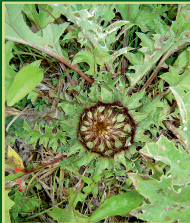
Carlina acanthifolia All. Primožnoliski kravljak