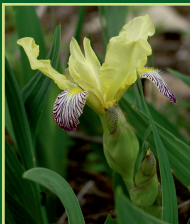
Iris variegata L. Šarena perunika