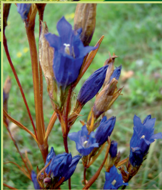
Gentiana pneumonanthe L. Plućna sirištara