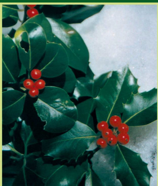
Ilex aquifolium L. Božikovina