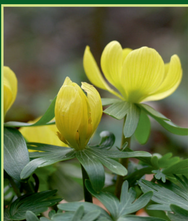
Eranthis hyemalis (L.) Salisb. Ozimnica