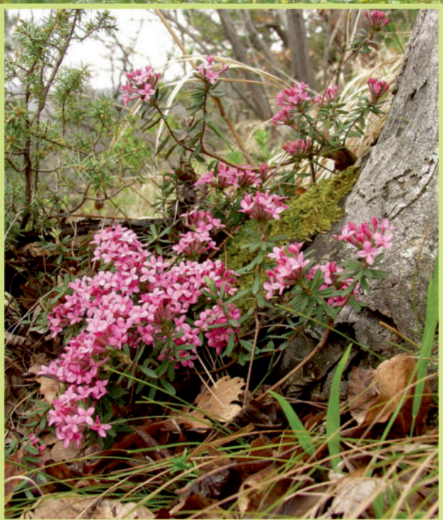
Daphne cneorum L. Crveni likovac