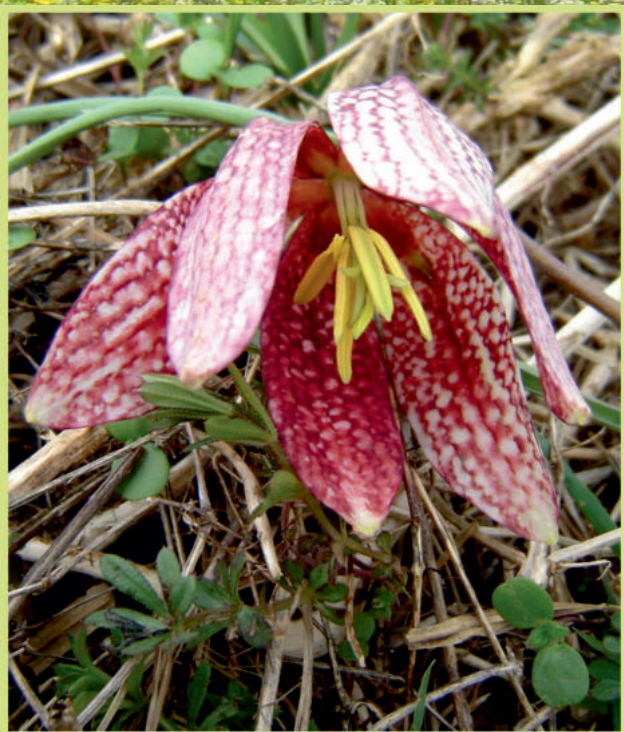
Fritillaria meleagris L. Obična kockavica