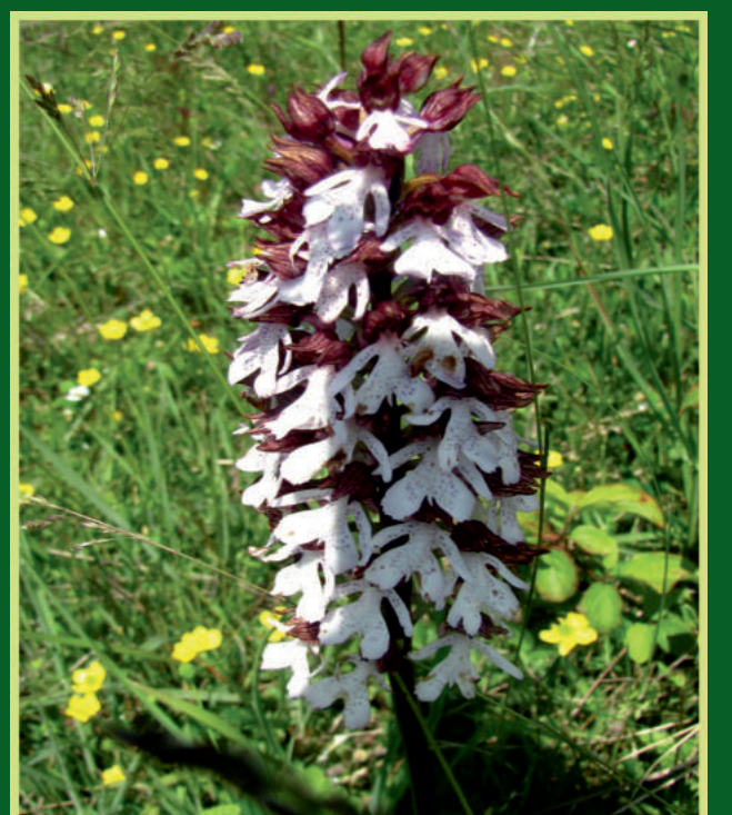
Orchis purpurea Huds. Grimizni kačun