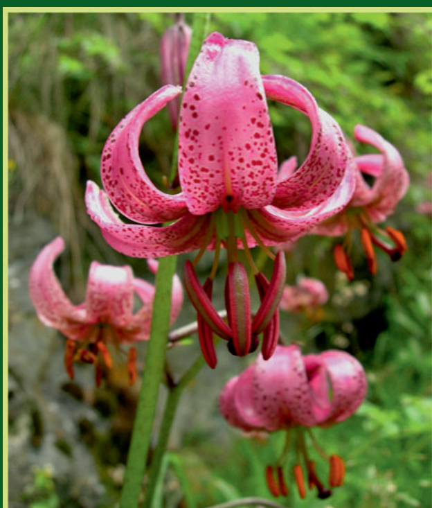
Lilium martagon L. Lilijan zlatan