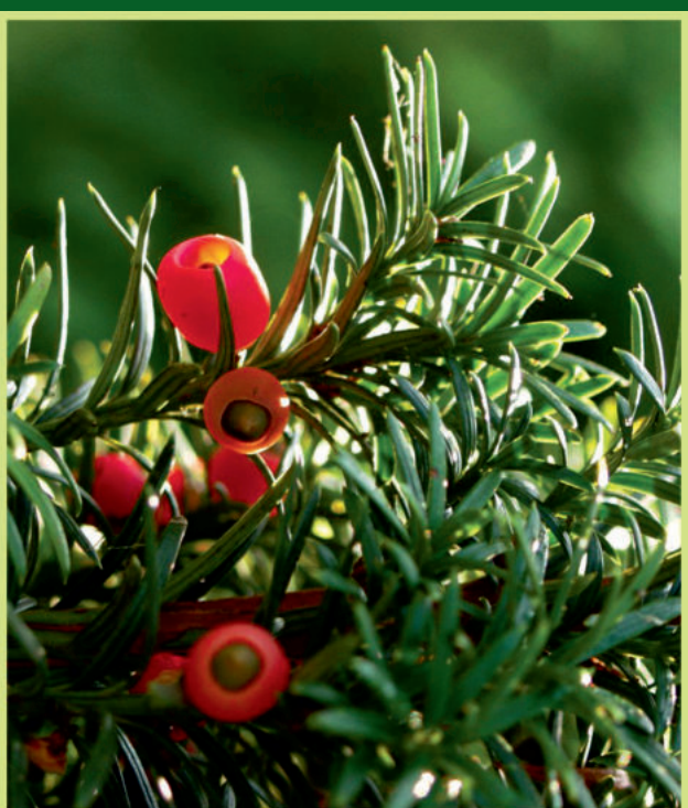
Taxus baccata L. Obična tisa