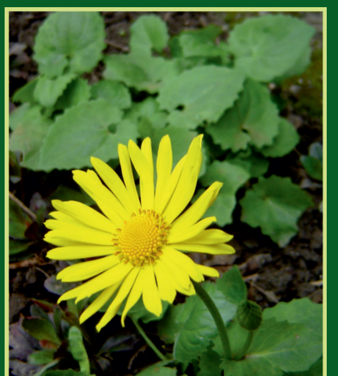
Doronicum orientale Hoffm. Kavkaski divokozjak

Požeška kotlina okružena zelenim šumskim prstenom Papuka, Psunja, Požeške gore, Krndije, Dilja i Babje gore ističe svoju posebnost bogatstvom biljnog svijeta što je rezultat geoloških, morfoloških, pedoloških i klimatskih osobina. Raznovrsni sastav flore u šumama, livadama, travnjacima i vlažnim staništima uvjetovan je ispreplitanjem panonskih, kontinentalnih i dijelom submediteranskih biljnogeografskih utjecaja.