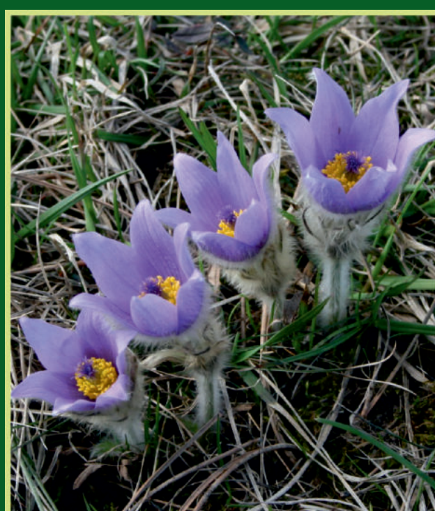
Pulsatilla grandis Wender. Velika sasa