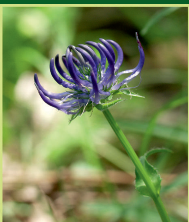
Phyteuma orbiculare L. Okruglasta zečica