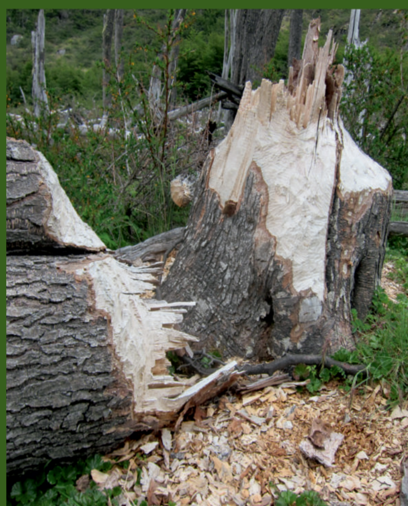
Štete od dabara.

Praćenjem stanja utvrđeno je rapidno širenje dabara u lipičkom i pleterničkom području u posljednjih desetak godina. Štete čini pregrađivanjem vodotoka, na poljoprivrednim površinama i u voćnjacima.