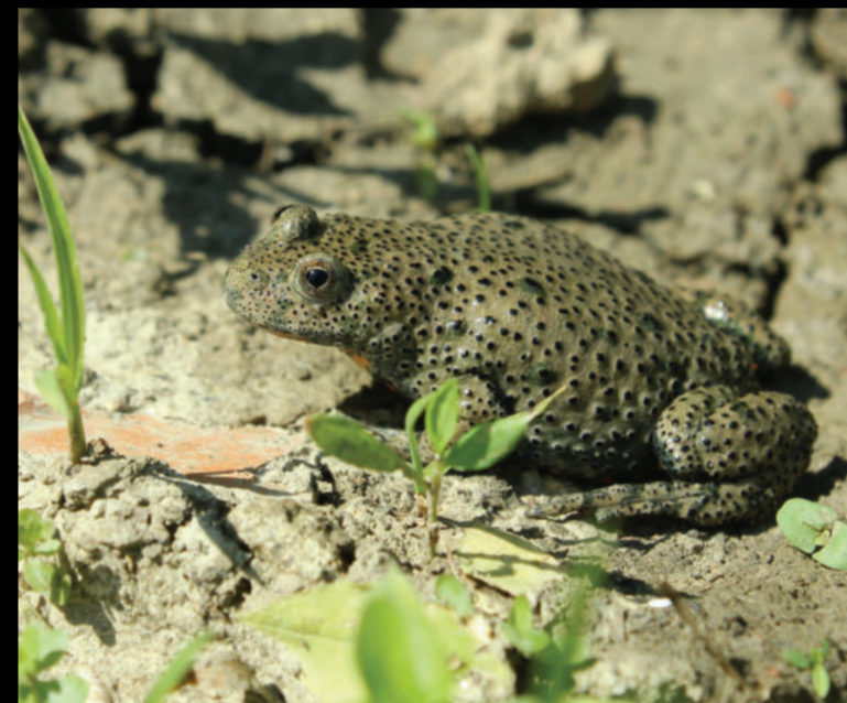
Bombina bombina – crveni mukač