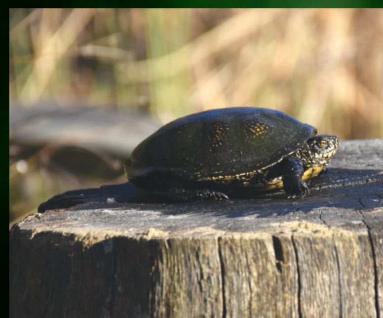
Emys orbicularis – barska kornjača