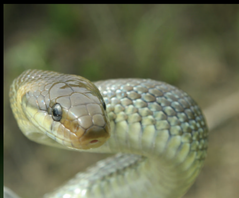
Zamenis longissimus – bjelica