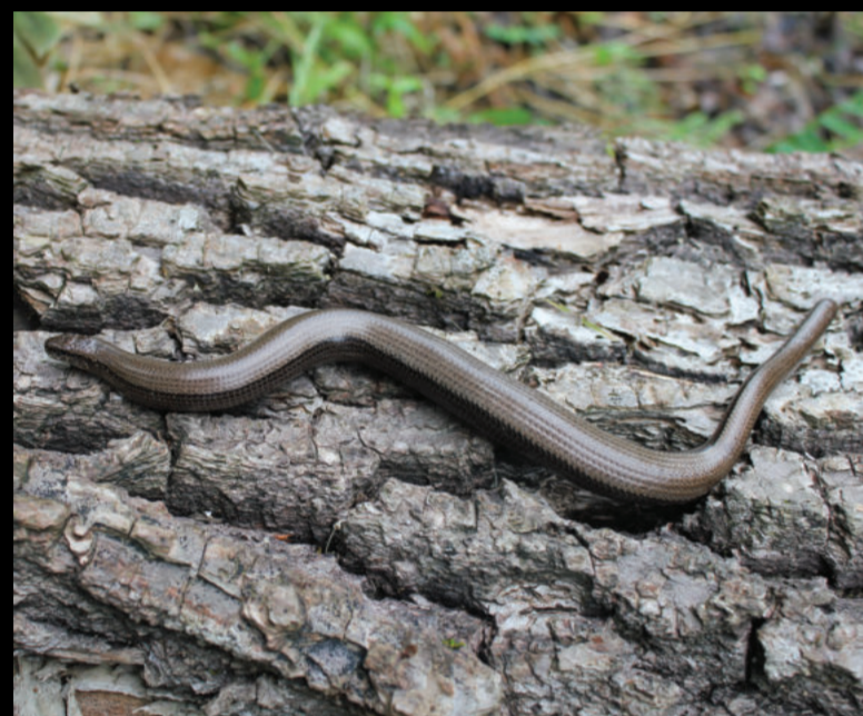
Anguis fragilis – sljepić