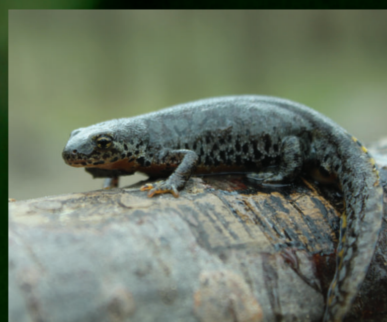
Ichthyosaura alpestris – planinski vodenjak