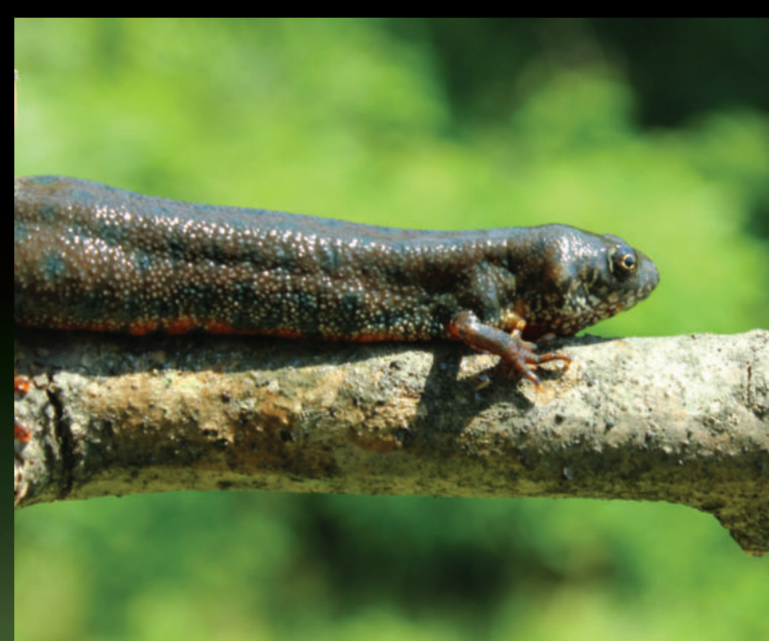
Triturus dobrogicus – podunavski vodenjak