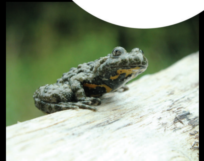
Bombina variegata – žuti mukač