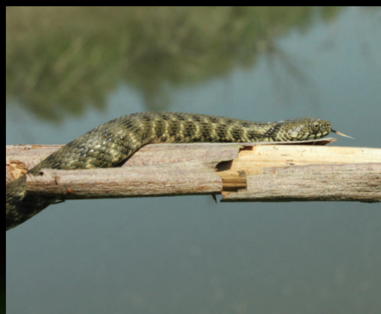
Natrix tessellata – ribarica