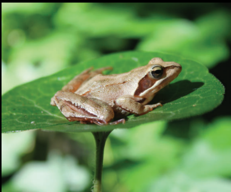
Rana dalmatina – šumska smeđa žaba