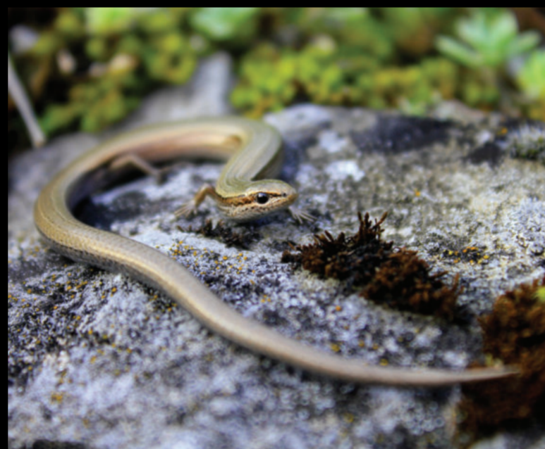
Ablepharus kitaibelii – ivanjski rovaš