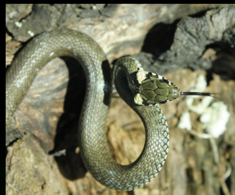
Natrix natrix – bjelouška