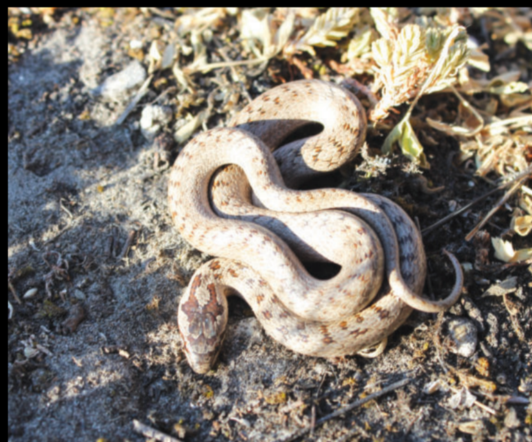
Coronella austriaca – obična smukulja