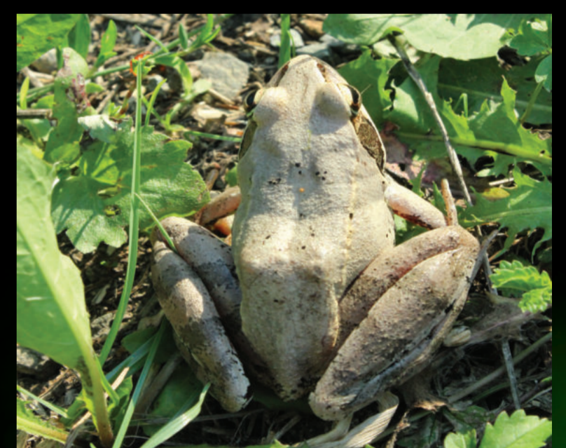
Rana arvalis – močvarna smeđa žaba