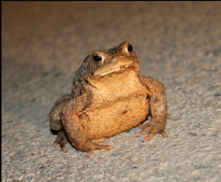
Bufo bufo – smeđa krastača