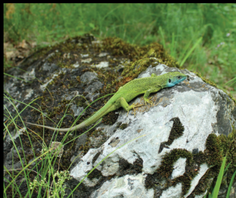
Lacerta viridis – obični zelembać