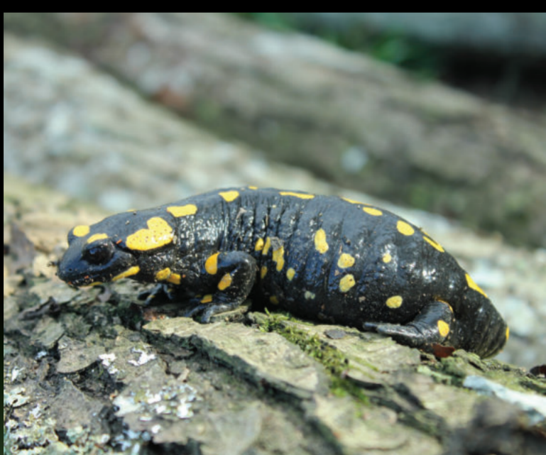
Salamandra salamandra – pjegavi daždevnjak