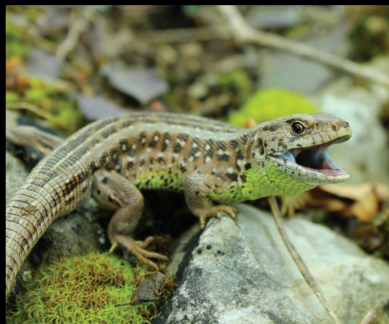
Lacerta agilis – livadna gušterica