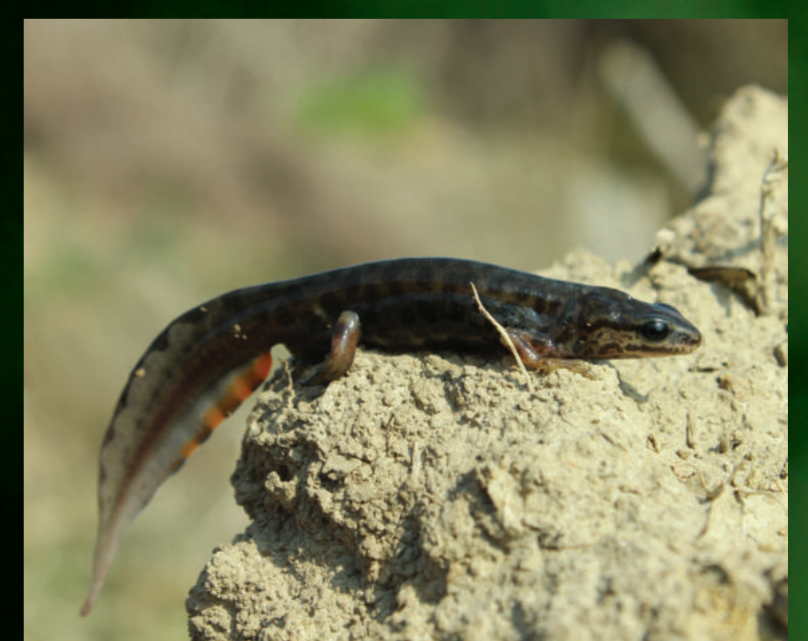
Lissotriton vulgaris – mali vodenjak