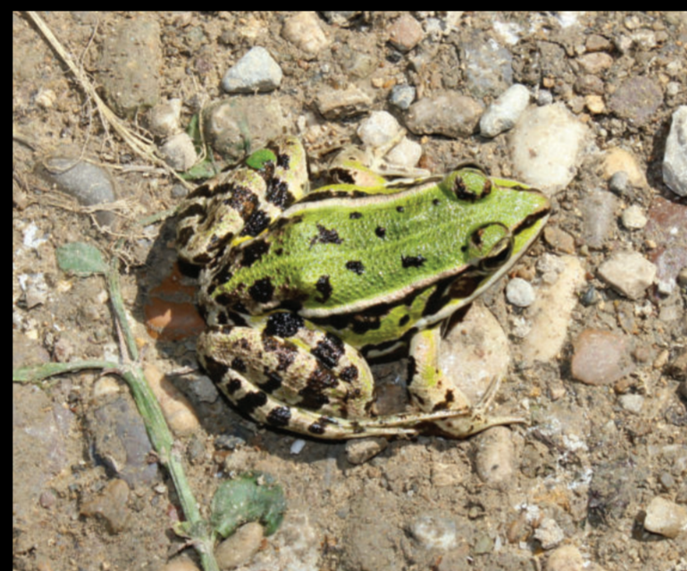
Pelophylax lessonae – mala zelena žaba