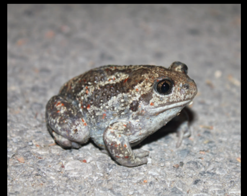
Pelobates fuscus – češnjača