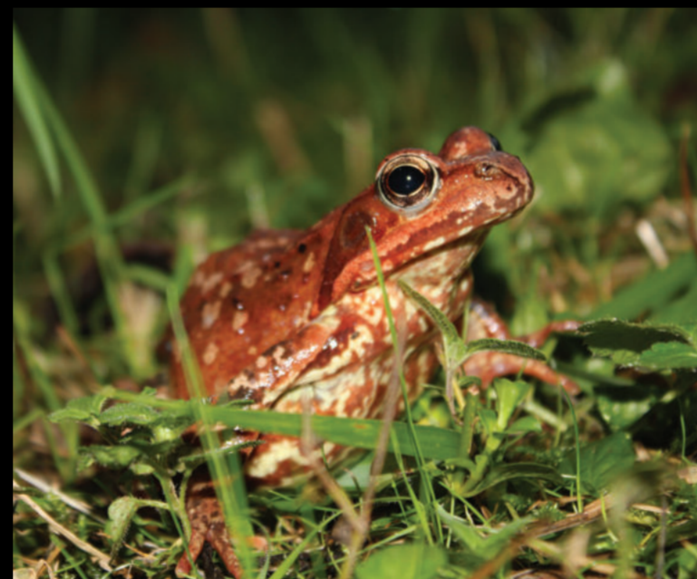
Rana temporaria – livadna smeđa žaba