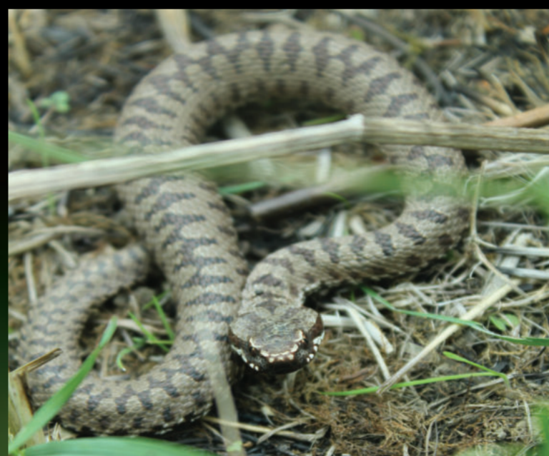
Vipera berus – riđovka