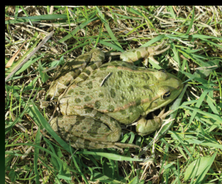
Pelophylax ridibundus – velika zelena žaba