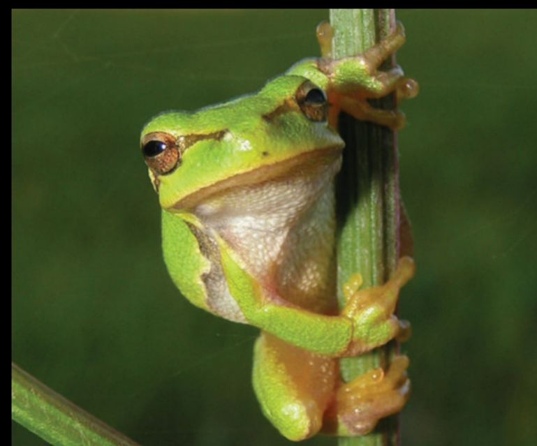
Hyla arborea – obična gatalinka