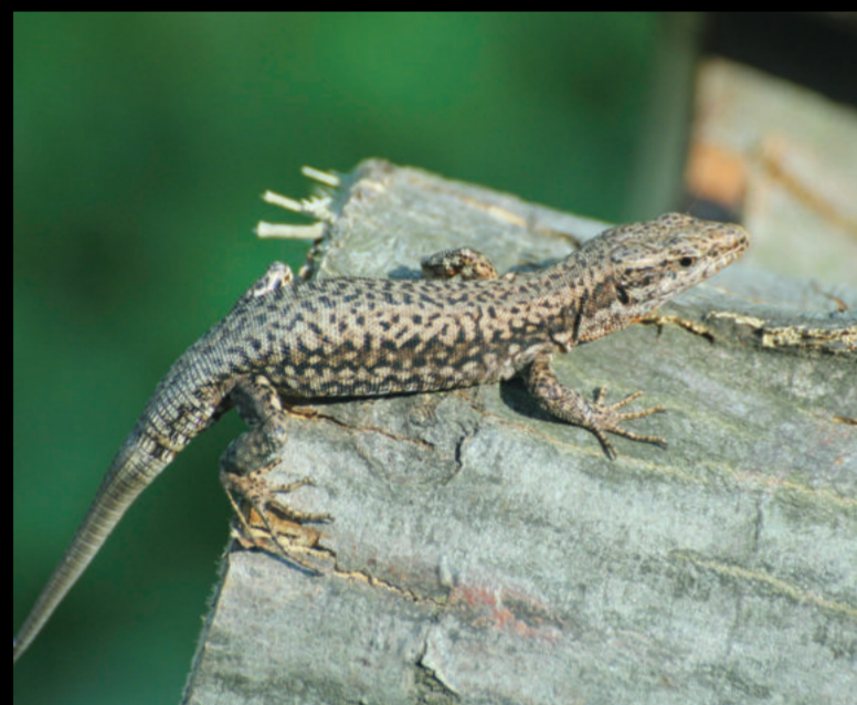
Podarcis muralis – zidna gušterica