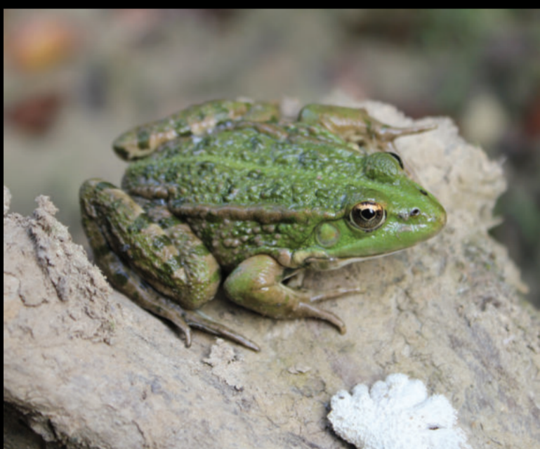
Pelophylax kl. esculentus – zelena žaba