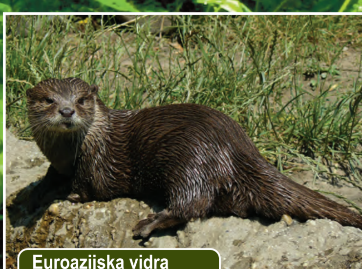
Europska vidra Lutra lutra