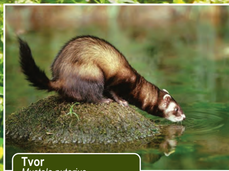
Tvor Mustela putorius