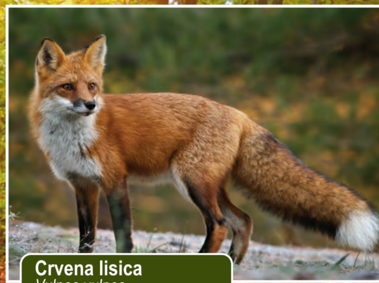
Crvena lisica Vulpes vulpes