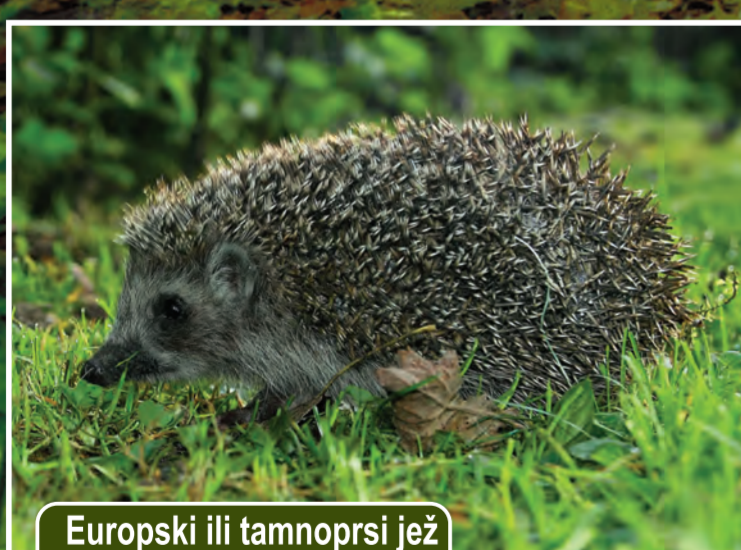
Europski ili tamnoprsi jež Ermaceus europaeus