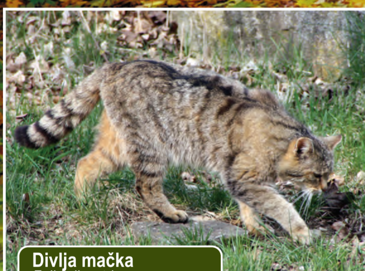
Divlja mačka Felis silvestris