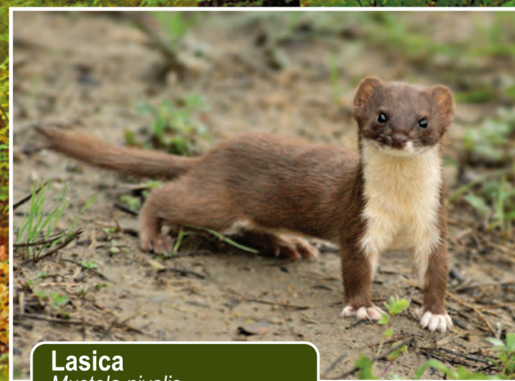
Lasica Mustela nivalis