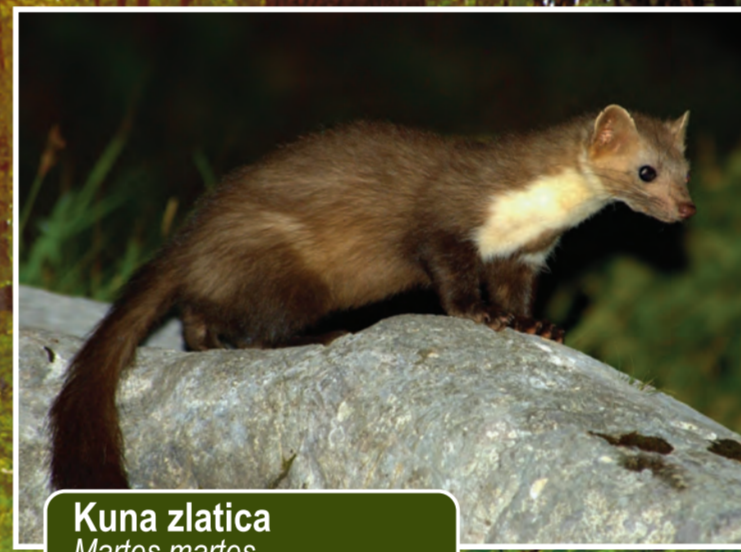
Kuna zlatica Martes martes