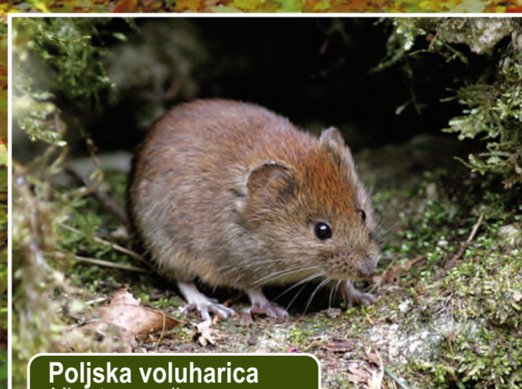
Poljska voluharica Microtus arvalis