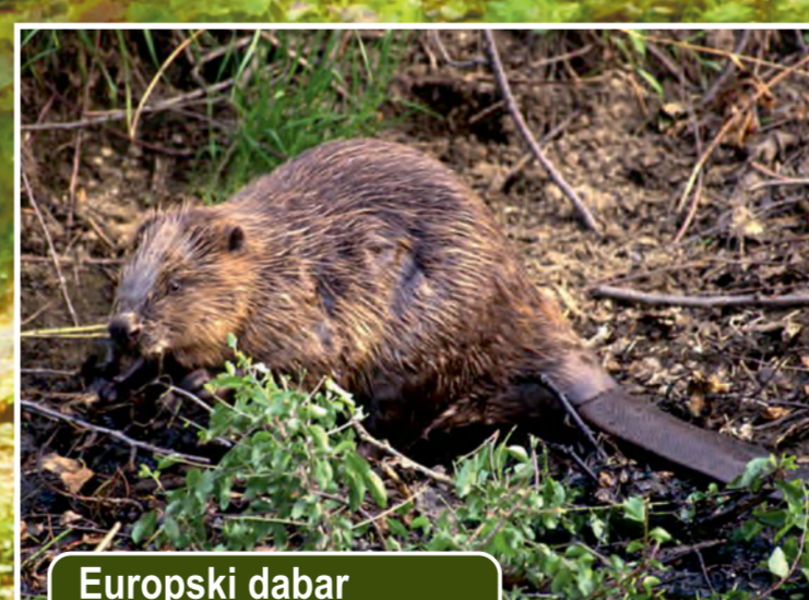
Europski dabar Castor fiber