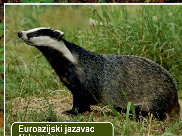
Europski jazavac Meles meles