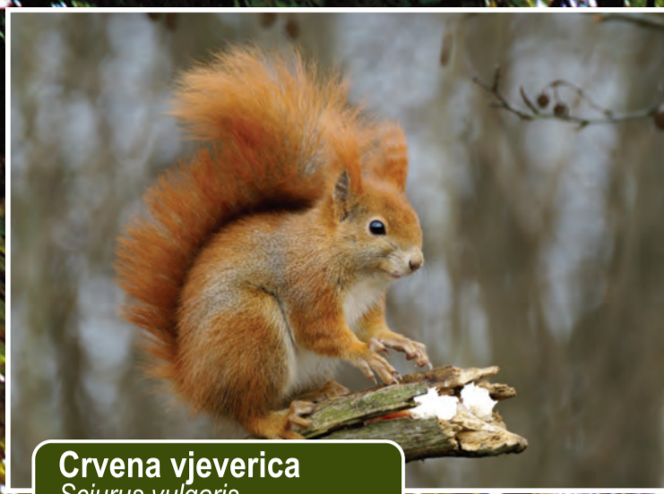
Crvena vjeverica Sciurus vulgaris