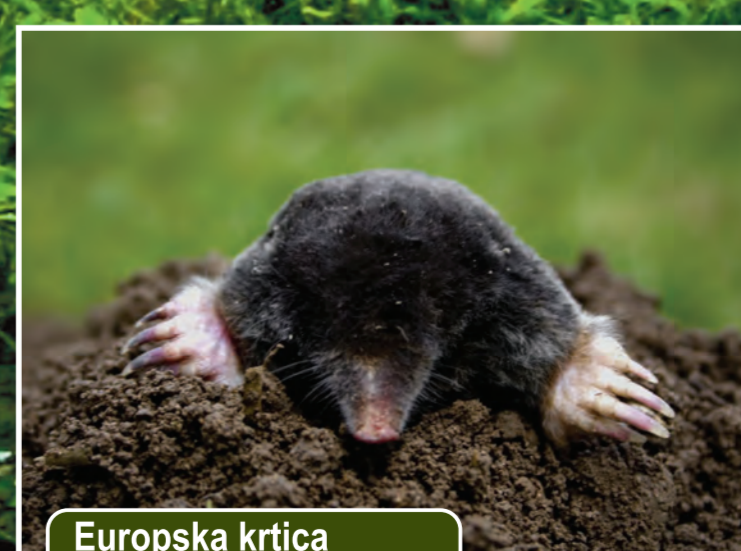
Europska krtica Talpa europaea

Sisavci (Mammalia) su razred toplokrvnih kralježnjaka. Uglavnom rađaju žive mlade koje ohranjuju mlijekom iz mliječnih žlijezda. Koža im je pokrivena dlakom. Na svijetu danas postoji oko 5500 različitih vrsta sisavaca koji naseljavaju sve kontinente i oceane. Od 101 vrste sisavaca, koliko ih je zabilježeno u Hrvatskoj, u slobodnoj prirodi, u Požeško – slavonskoj županiji stalno i povremeno boravi šezdesetak vrsta. Od najvećih sisavaca ovdje žive jeleni, srne, divlje svinje, čagljevi, lisice, jazavci i divlje mačke. Zanimljivost je dvadesetak vrsta šišmiša koju su indikatori čistog okoliša. Od rijetkih i zaštićenih vrsta ovdje žive: vidra, dabar, šišmiši, rovkice, puhovi. Prije dvjesto godina na ovom području su živjele velike zvijeri - vukovi, medvjedi i risovi, ali su vremenom nestali zbog smanjenja životnog prostora uslijed sječe šuma i izlova.