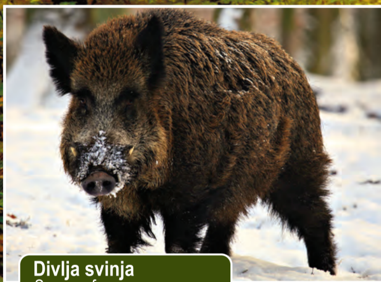
Divlja svinja Sus scrofa