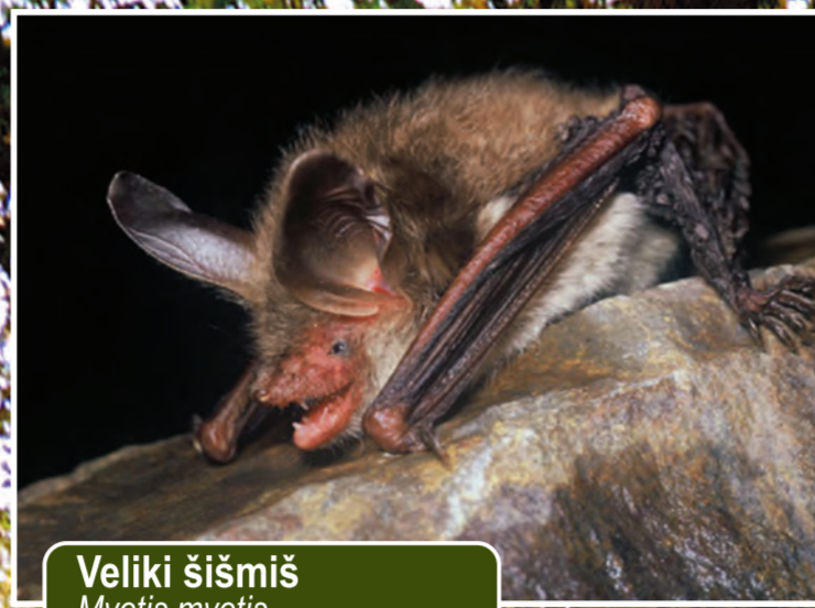
Veliki šišmiš Myotis myotis