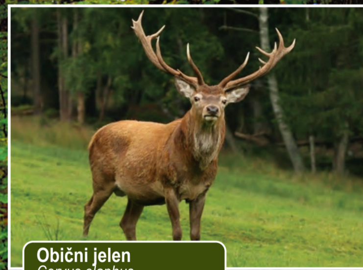
Obični jelen Cervus elaphus