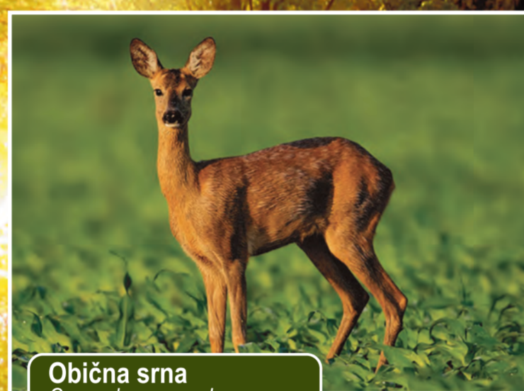
Obična srna Capreolus capreolus