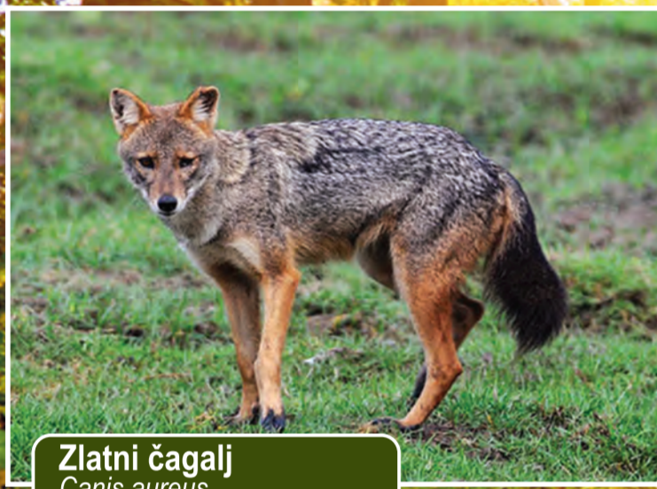
Zlatni čagalj Canis aureus