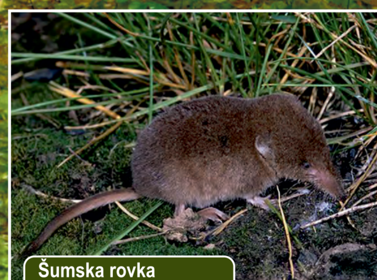
Šumska rovkica Sorex araneus