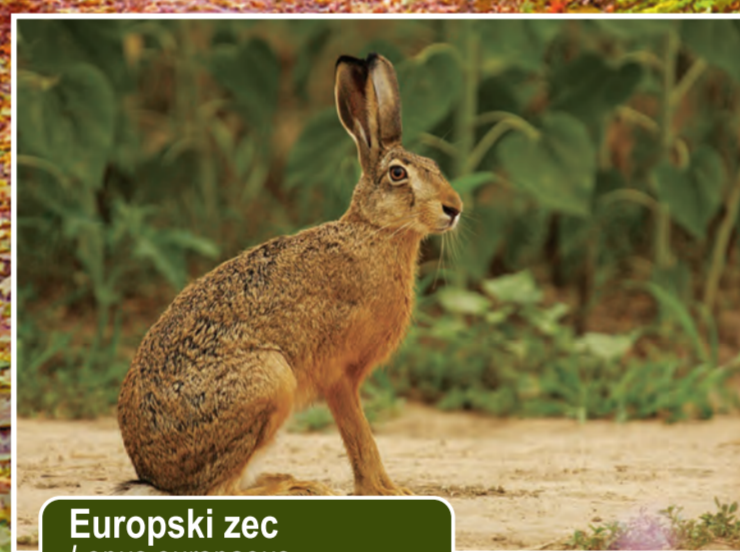
Europski zec Lepus europaeus