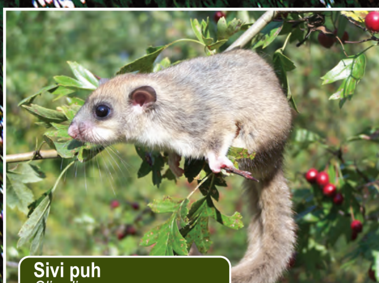
Sivi puh Glis glis