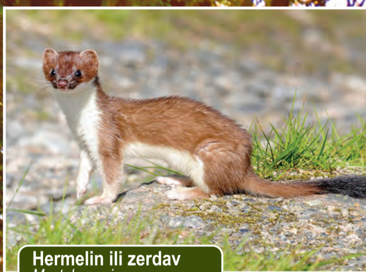
Hermelin ili zerdav Mustela erminea