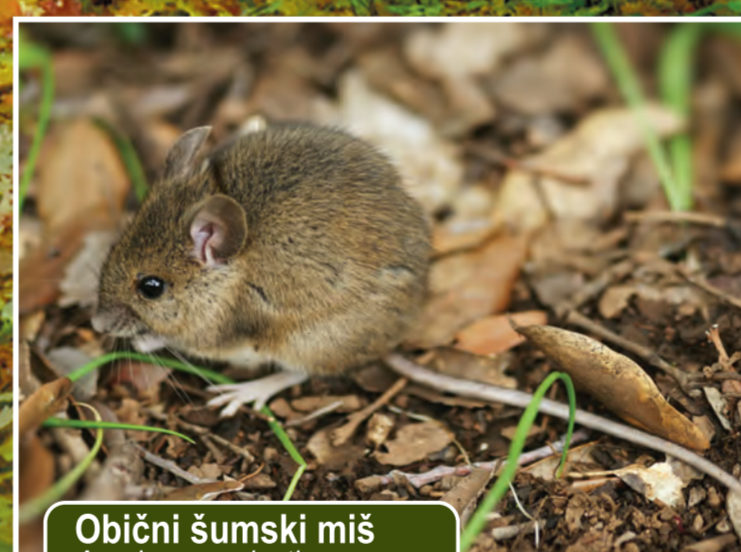
Obični šumski miš Apodemus sylvaticus